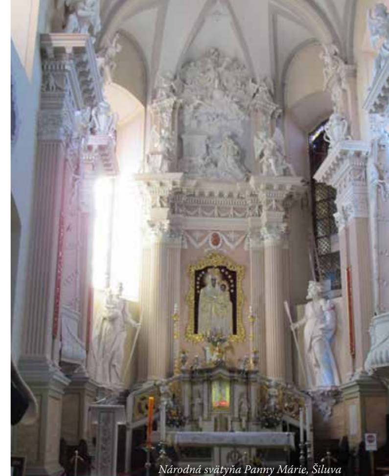
Národná svätýňa Panny Márie, Šiluva

Nasledovala cesta do Pskova, kde sme mali ubytovanie. Tam sme navštívili Chrám Najsvätejšej Trojice.