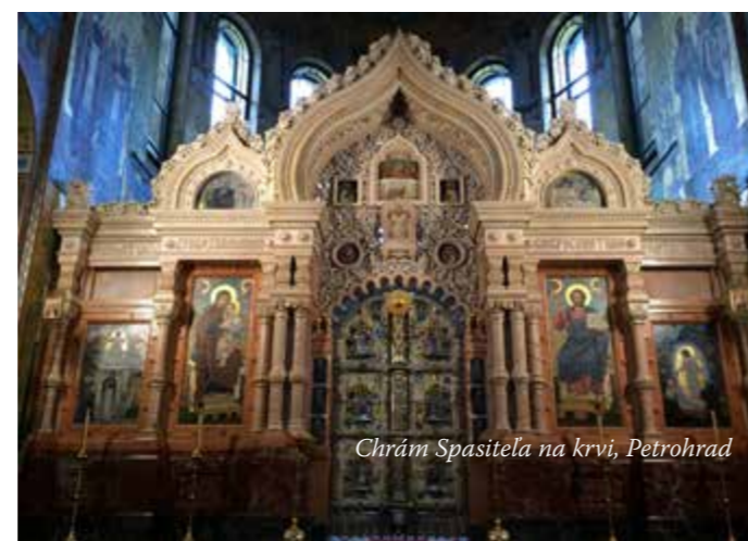
Chrám Spasiteľa na krvi, Petrohrad

Z Talína sme pokračovali do mesta Narva pri ruských hraniciach, kde sme boli ubytovaní. Ráno po raňajkách sme si ešte prezreli mesto a presunuli sa k hraniciam, kde sme absolvovali colnú a pasovú kontrolu. Po prechode hraníc sme sa vydali smerom k Petrohradu. Mesto Petrohrad - perla našej púte. Hovorí sa mu aj Benátky severu, keďže je postavený na malých ostrovoch a bažinách. Založil ho cár Peter I. 27. 5. 1703 ako nové moderné mesto podľa svojich predstáv a vzoru západných krajín, ktoré rád a často navštevoval. Mesto zažívalo vo svojej krátkej histórii veľké turbulencie. Najväčšou pohromou bola jeho blokáda počas druhej svetovej vojny. Mesto bolo obklúčené nepriateľom takmer 900 dní, bez prísunu